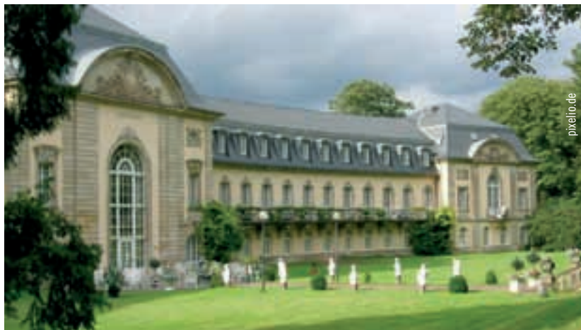
Das 1906 auf Initiative von Podbielski im Neu-Rokoko-Stil errichtete große Schwefelbadehaus beherbergt heute das Grandhotel Esplanade und ist in den historischen Kurpark der Stadt Bad Nenndorf eingebettet.

Auch der idyllische Kurort Bad Nenndorf verdankt seinen Park am „Erlengrund“ der Förderung des damaligen Staatsministers und sein Abbild in Bronze zeugt auch dieserorts von dessen Beliebtheit. Sein Begräbnis 1916 auf dem Familienfriedhof neben der Kirche in Dallmin zählte einige hundert Besucher aus den unterschiedlichsten Bevölkerungsschichten und zeigte die außerordentliche Popularität des Staatsmannes, Landjunkers, Unternehmers, Pferdenarren und „Olympioniken“-eines echten Tausendsassas, der im Herzen Hannovers ein würdiges Denkmal innehat und als „Podbi“ noch immer in aller Munde ist.