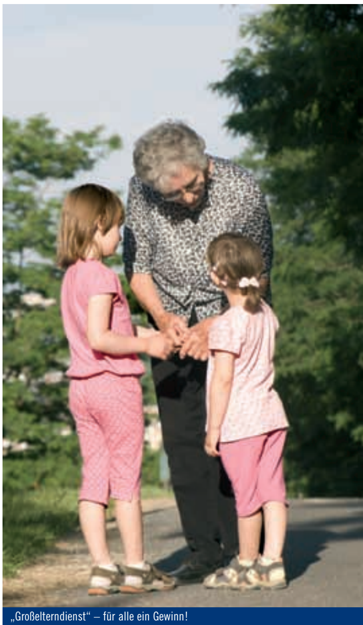
„Großeltern dienst“ – für alle ein Gewinn!

von angepasstem Wohnraum, so dass die Bewohner mittels Nachbarschaftshilfe sowie ambulanten und sozialen Diensten Ihre Selbständigkeit bewahren können.