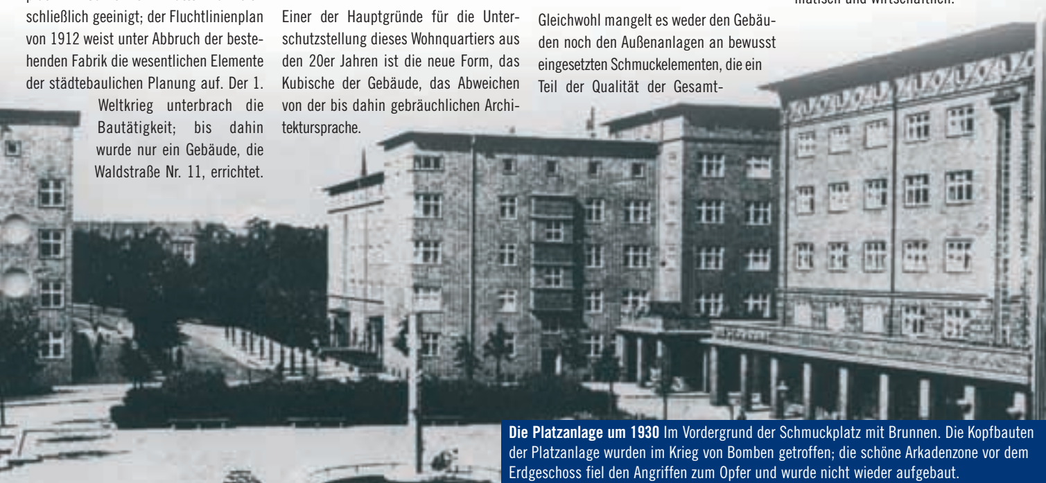
Die Platzanlage um 1930 Im Vordergrund der Schmuckplatz mit Brunnen. Die Kopfbauten der Platzanlage wurden im Krieg von Bomben getroffen; die schöne Arkadenzone vor dem Erdgeschoss fiel den Angriffen zum Opfer und wurde nicht wieder aufgebaut.

anlage ausmachen. Leider ist auch davon viel verlorengegangen: Im Krieg wurden besonders um den Schmuckplatz mit Brunnen einige Gebäude stark zerstört, die Arkadenreihe vor diesen Häusern war stark geschädigt und wurde nicht wieder aufgebaut. Die Blockränder zur Wittekindstraße wurden vollständig zerstört. Beim Wiederaufbau hat man in der Regel die wesentlichen Elemente der Gebäudestruktur berücksichtigt – dies war pragmatisch und wirtschaftlich.