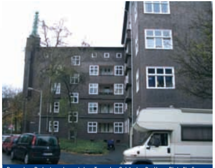
Besondere Bedeutung kommt dem Turm des Gebäudes De-Haen-Platz Nr. 3 zu. Die aus der Hausecke herauswachsende expressionistische Ziegelplastik wird durch eine vom Kubismus beeinflusste Kupferplastik des Turmes bekrönt.

Einer der Hauptgründe für die Unterschutzstellung dieses Wohnquartiers aus den 20er Jahren ist die neue Form, das Kubische der Gebäude, das Abweichen von der bis dahin gebräuchlichen Architektursprache.