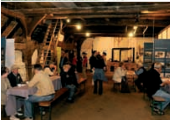
Ganz wie in alten Zeiten: Der Museumshof bietet Geschichte zwar nicht immer zum Anfassen, dafür aber auf jeden Fall zum Erleben.