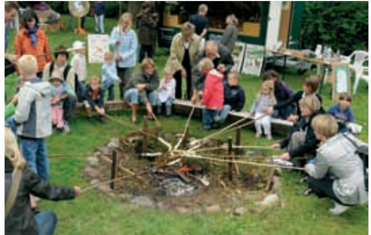
Spiel und Spaß für die ganze Familie – und lehrreich noch dazu: Die Lions Landpartie 2008 brachte den Besuchern das Leben auf dem Bauernhof, wie es vor 100 Jahren war, anschaulich nahe.