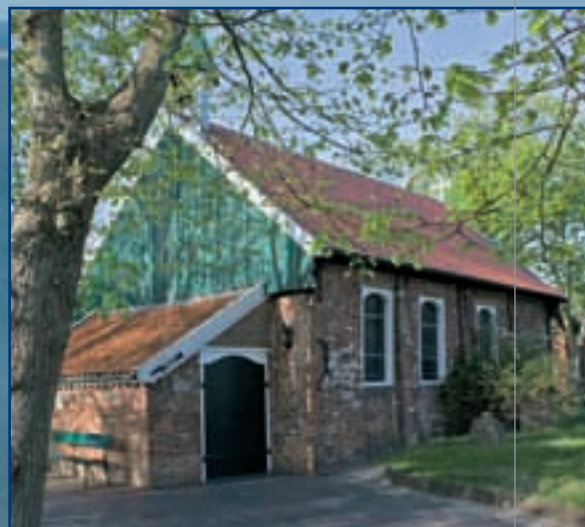
Die alte Inselkirche auf Spiekeroog (erbaut 1696)