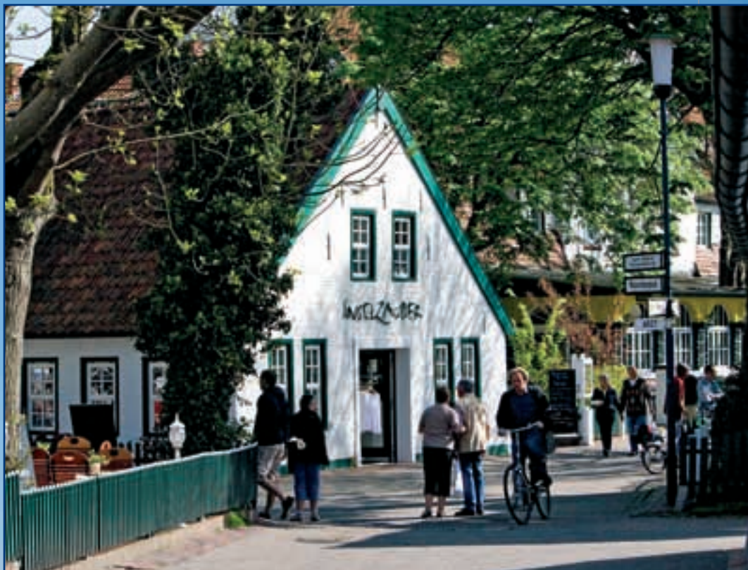
Der alte Dorfkern weist viele alte Bäume auf. Die Bebauung ist in weiten Teilen ursprünglich.

Neben der Sommerzeit ist Spiekeroog auch im Herbst und Winter empfehlenswert. Wenn die Insel fast ohne Urlauber, die Nordsee besonders rau und Wind und Wetter intensiv sind, fühlt sich der wahre Nordsee-Fan erst richtig wohl. Dann dominiert die Natur so sehr das Tagesgeschehen, dass man sich in eine vergangene Zeit versetzt fühlt. In der gab es auf Spiekeroog noch keinen Badebetrieb, keine Feriengäste. Nur Fischer und viel Natur. ■